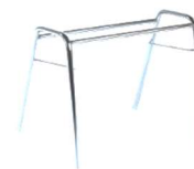
Trapez 20x1,5 mm