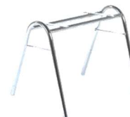
Parabel 22x2 mm